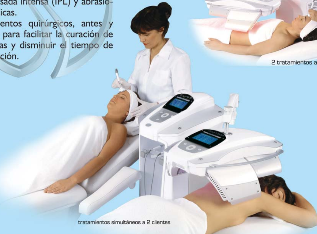
tratamientos simultáneos a 2 clientes