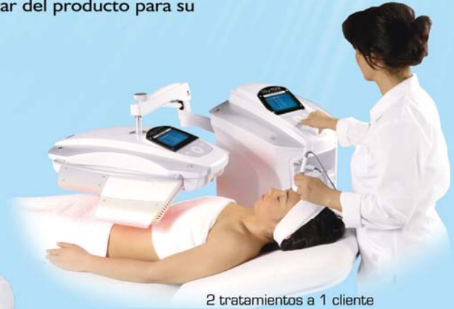
2 tratamientos a 1 cliente