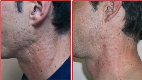
Después 10ª sesión